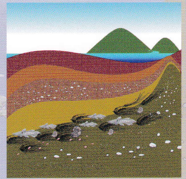
現在（河や火山の堆積、隆起により陸上土壌となる）